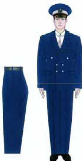
3.2. Modelul uniformei pentru comisarii Gărzii Financiare