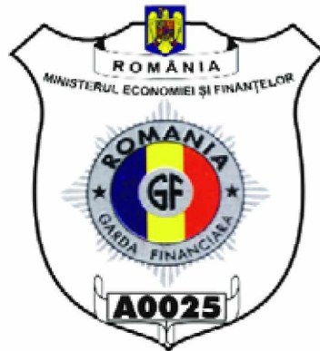
3.5. Modelul insignei metalice înseriate, pe suport din piele, atașabilă la uniformă