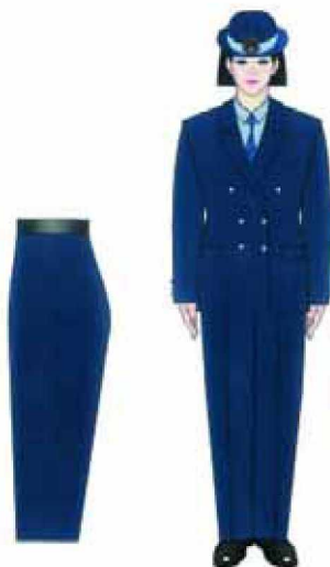
3.2.2. Modelul uniformei pentru comisarii Gărzii Financiare — femei: varianta cu pantalon