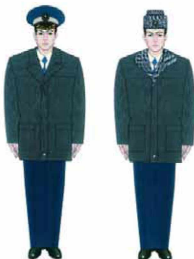
3.3. Modelul uniformei de iarnă pentru comisarii Gărzii Financiare: scurtă din piele cu mesadă și guler detașabile, căciulă din nutriet sau astrahan