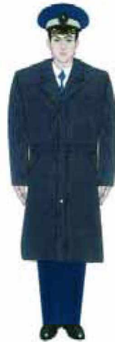
3.4. Modelul uniformei pentru comisarii Gărzii Financiare: Manta din piele naturală