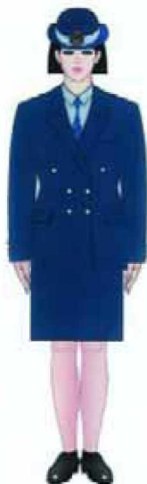
3.2.1. Modelul uniformei pentru comisarii Gărzii Financiare — femei: varianta cu fustă